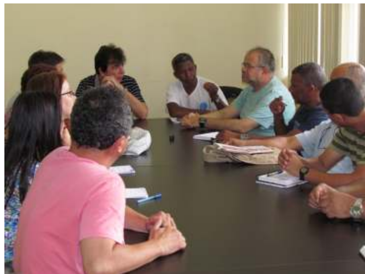
Sindicalistas apresentam suas preocupações acerca da empresa de direito privado