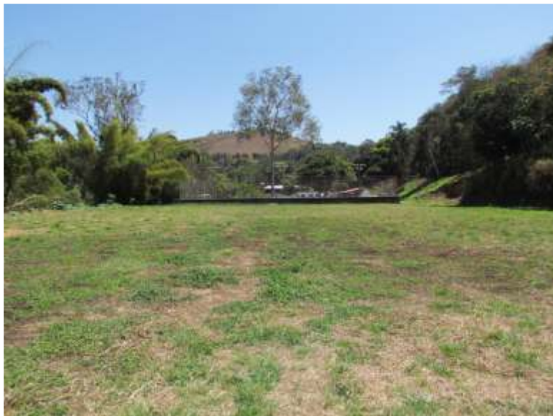
O novo campo será construído atrás do campo de futebol society