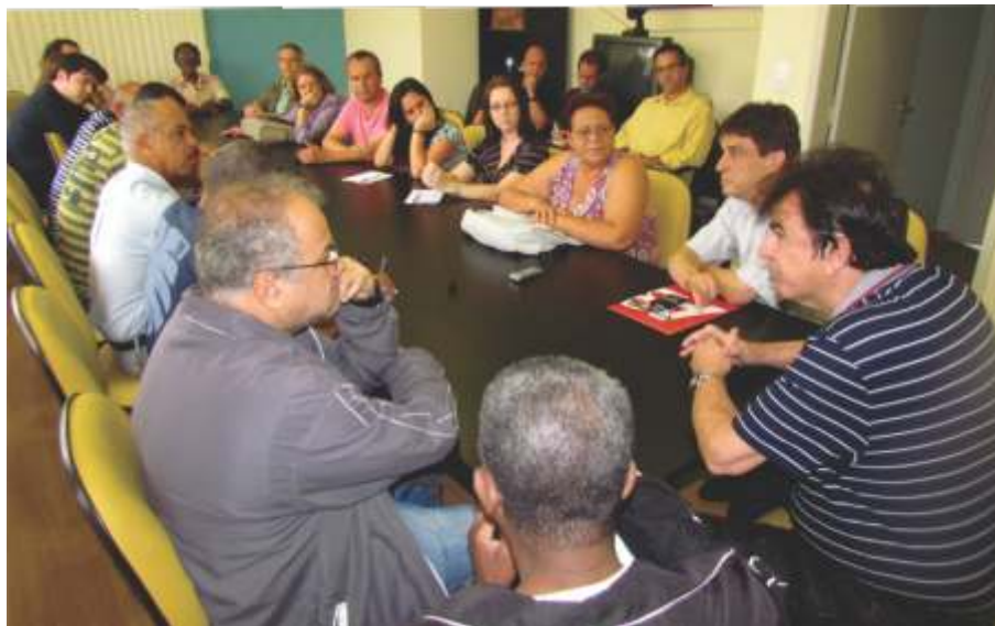
Reunião entre sindicalistas, reitor e diretor do HU no gabinete (reitoria)