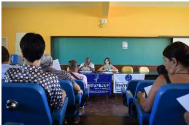
Assembleia faz alterações em documento

Objetivo do termo é garantir que não seja efetuado o corte de ponto após o fim da greve