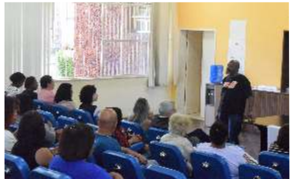
Representantes dos coletivos fazem defesa antes da votação

Nos dias seguintes a Plenária, 12 a 14 de setembro, a Fasubra participa da