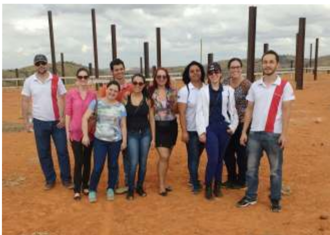
TAEs de Governador Valadares visitam obras paradas do Campus Avançado

Em atividade de paralisação, técnico-administrativos denunciam obras paradas em Campus Avançado