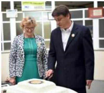
Bolo comemorativo é distribuído no hospital

Após a entrega da medalha foi realizada a apresentação do Coral Gavroche, em seguida um culto ecumênico no pátio interno do hospital, que terminou com a distribuição de um bolo comemorativo.